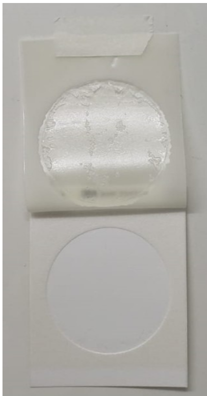
Figura 2: exposição da placa